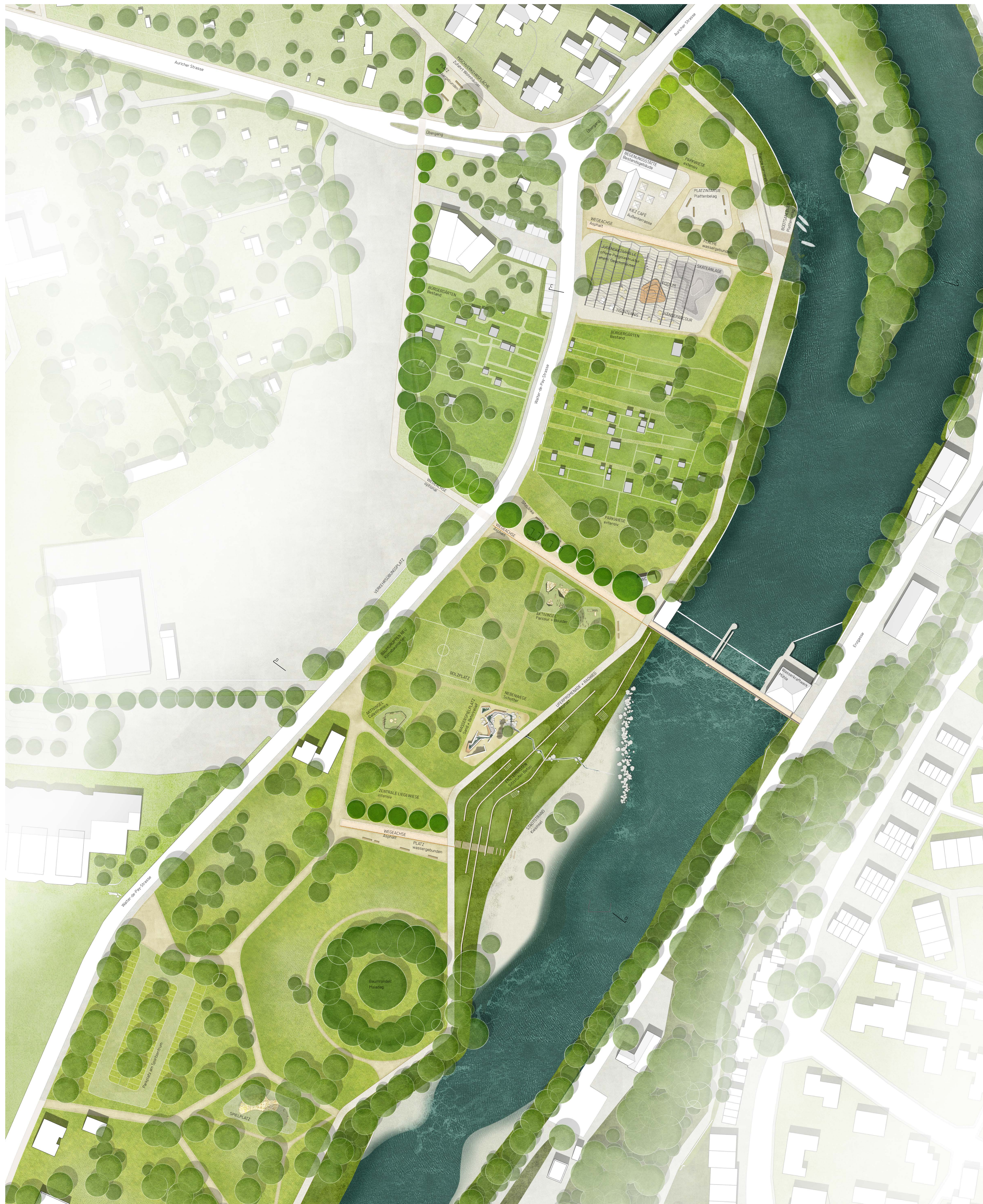
VERTIEFUNG WELLER AREAL UND UFERPARK MIT ENTERRASSEN M 1:500