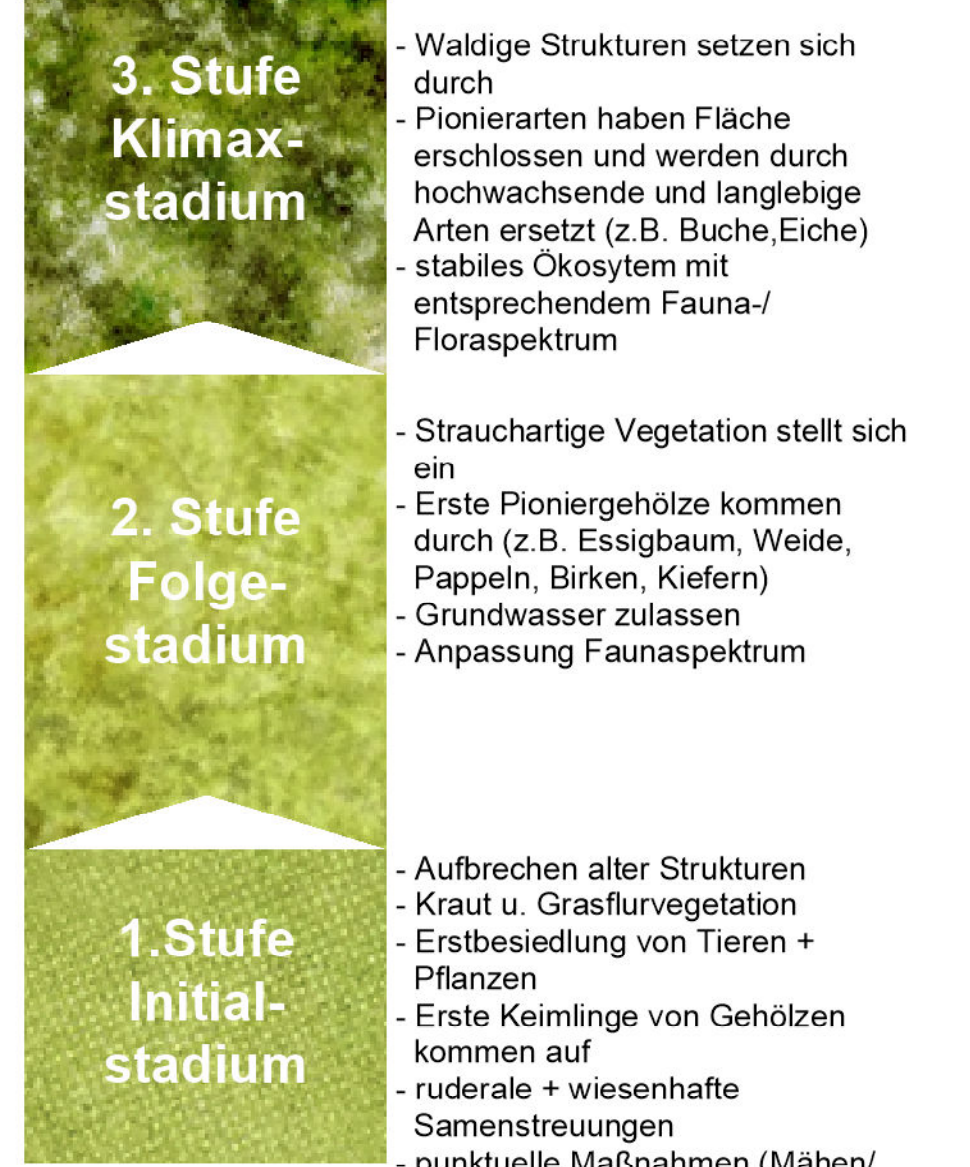
Schema Sukzession Erleben Häcker-Areal