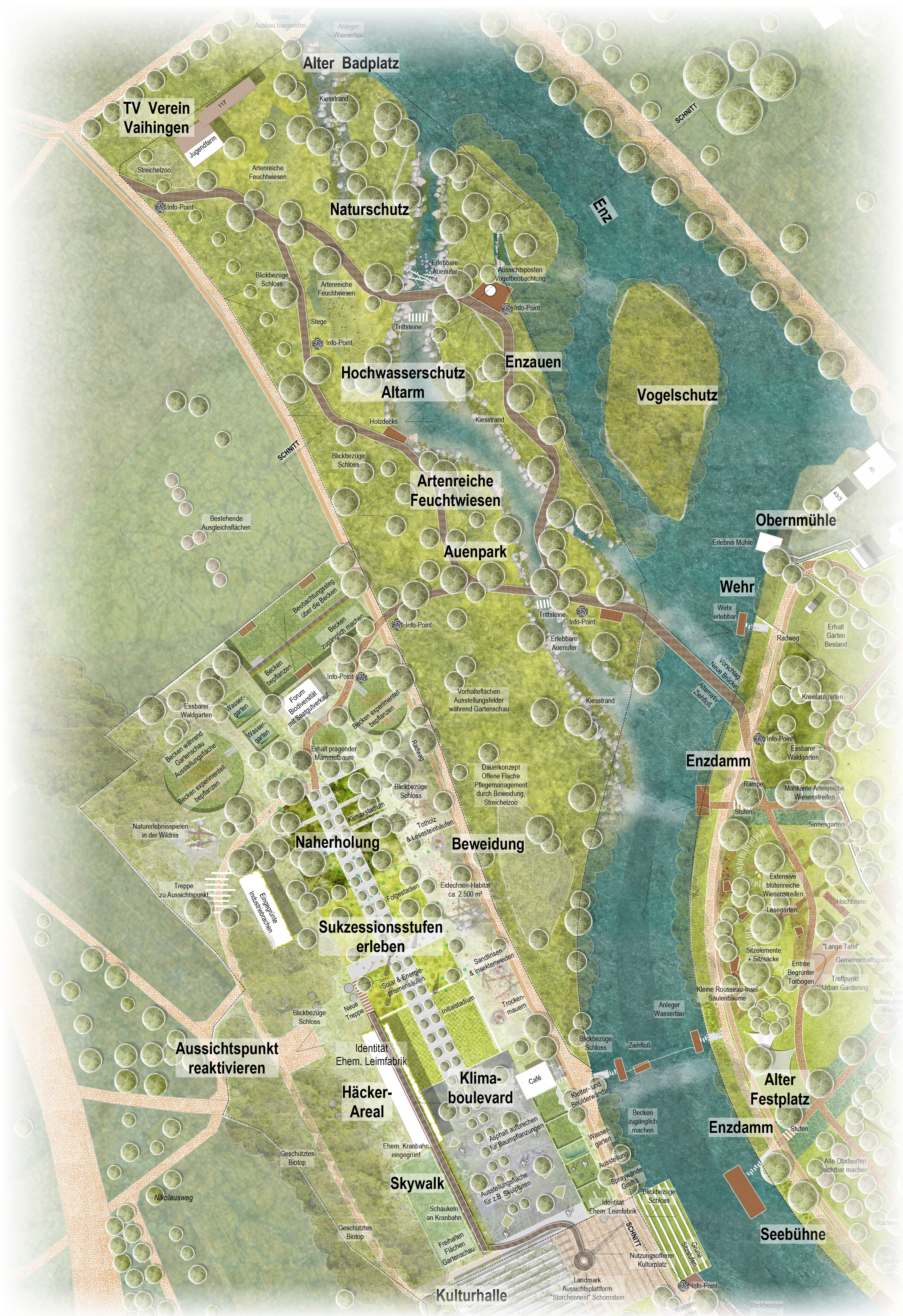
Realisierungsteil Häcker-Areal - Landschaftlicher Ideenteil / M 1:500