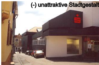
(-) unattraktive Stadtgestaltung an der Raichengasse