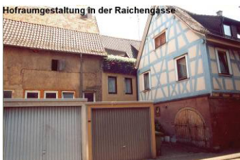
Hofraumgestaltung in der Raichengasse