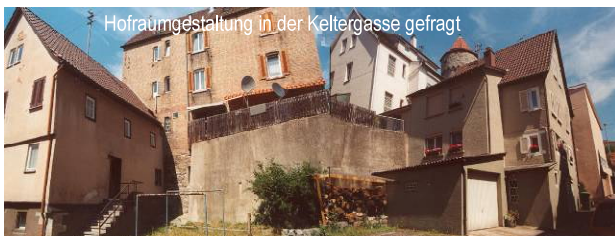
Hofraumgestaltung in der Keltergasse gefragt