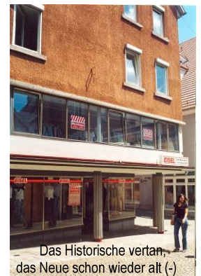
Das Historische veran, das Neue schon wieder alt (-)