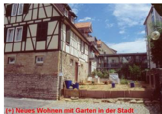
(+) Neues Wohnen mit Garten in der Stadt