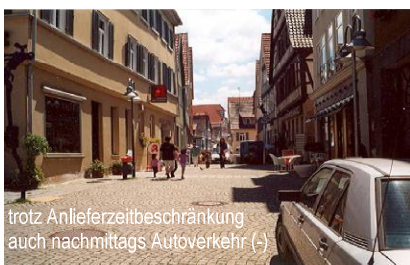
trotz Anlieferzeitbeschränkung auch nachmittags Autoverkehr (-)