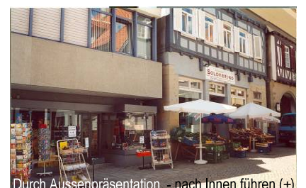
Durch Aussenpräsentation - nach Innen führen (+)