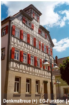
Denkmaltreue (+) EG-Funktion (-)