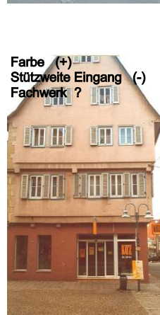
Farbe (+) Stützweite Eingang (-) Fachwerk ?