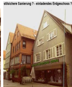
stilichere Sanierung ? - einladendes Erdgeschoss ?