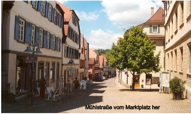
Mühlstraße vom Marktplatz her