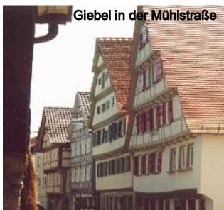
Giebel in der Mühlstraße