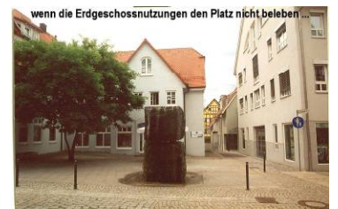
wenn die Erdgeschossnutzungen den Platz nicht beleben...