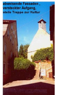
abweisende Fassaden, versteckter Aufgang, steile Treppe zur Kultur