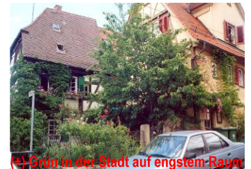
(-) Grün in der Stadt auf engstem Raum