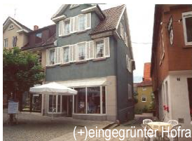
(+) eingegrünter Hofraum an der Stuttgarter Straße