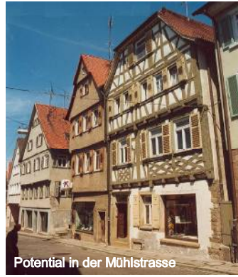
Potential in der Mühlstrasse