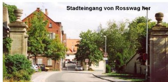
Stadtteingang von Rosswag her