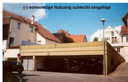
(-) notwendige Nutzung schlecht eingefügt