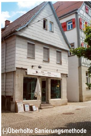
(-) Überholte Sanierungsmethode