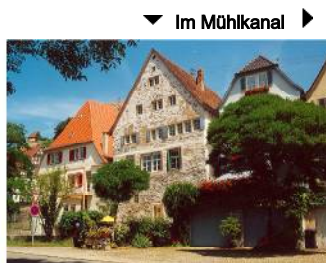
▼ Im Mülhkanal ►