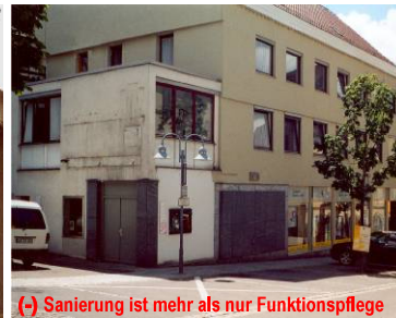
(-) Sanierung ist mehr als nur Funktionspflege