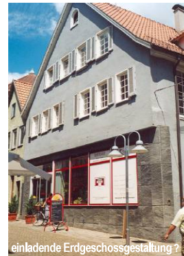
einladende Erdgeschossgestaltung ?