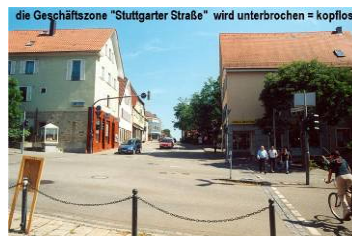
die Geschäftszone "Stuttgarter Straße" wird unterbrochen = kopflös