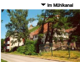
▼ Im Mülhkanal