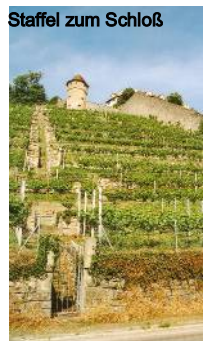
Staffel zum Schloß