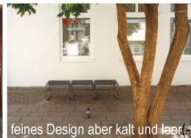
feines Design aber kalt und leer (-)