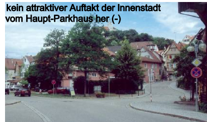
kein attraktiver Auftakt der Innenstadt vom Haupt-Parkhaus her (-)