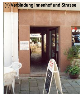
(+) Verbindung Innenhof und Strasse