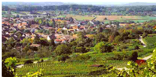
Ortsrand von Norden gesehen