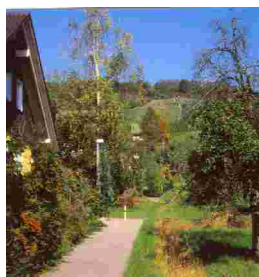
OR nördl. Horheimer Straße