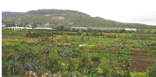
Ortsrand im Osten nördlich der Kleinglattbacher Straße