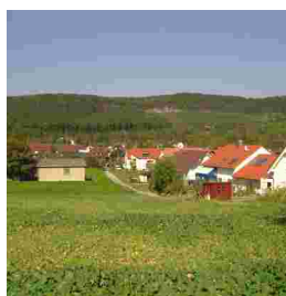
Ortsrand am Illinger Weg