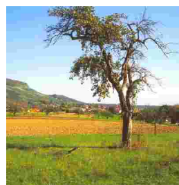
Ortsrand von Westen