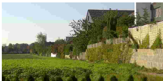
Ortsrand im Süden südlich der Kleinglattbacher Straße