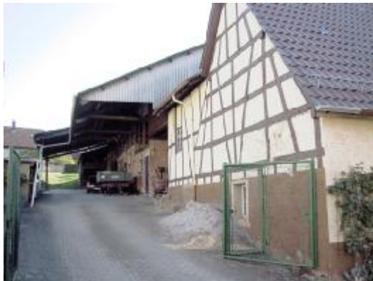
neuere Nebengebäude im rückwärtigen Bereich

Im alten Ortskern sind kaum neuere landwirtschaftliche Nebengebäude zu finden. Durch die meist von der Straße zurückversetzte Lage, fallen diese im Ortsbild nicht störend auf.