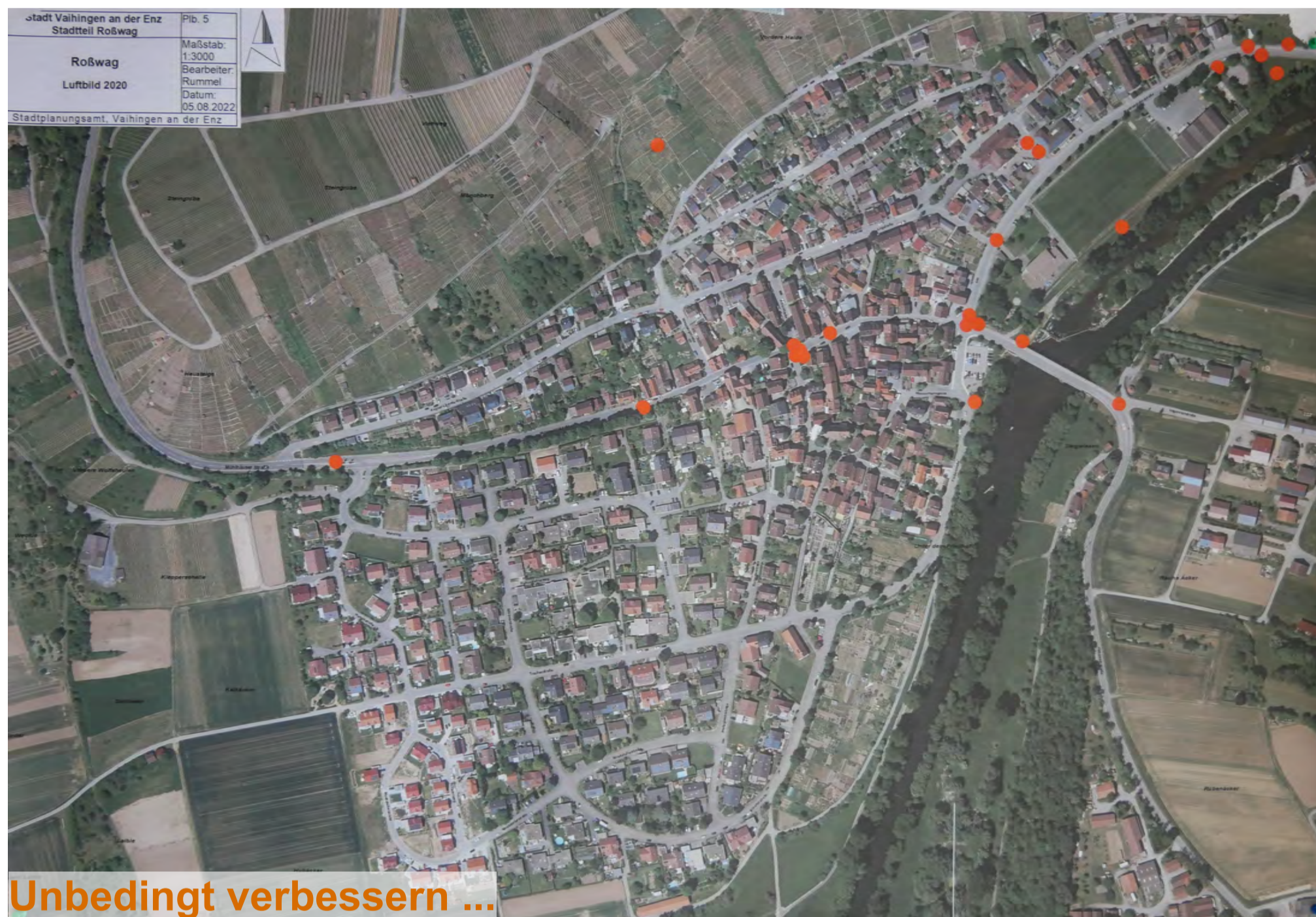
Unbedingt verbessern ...