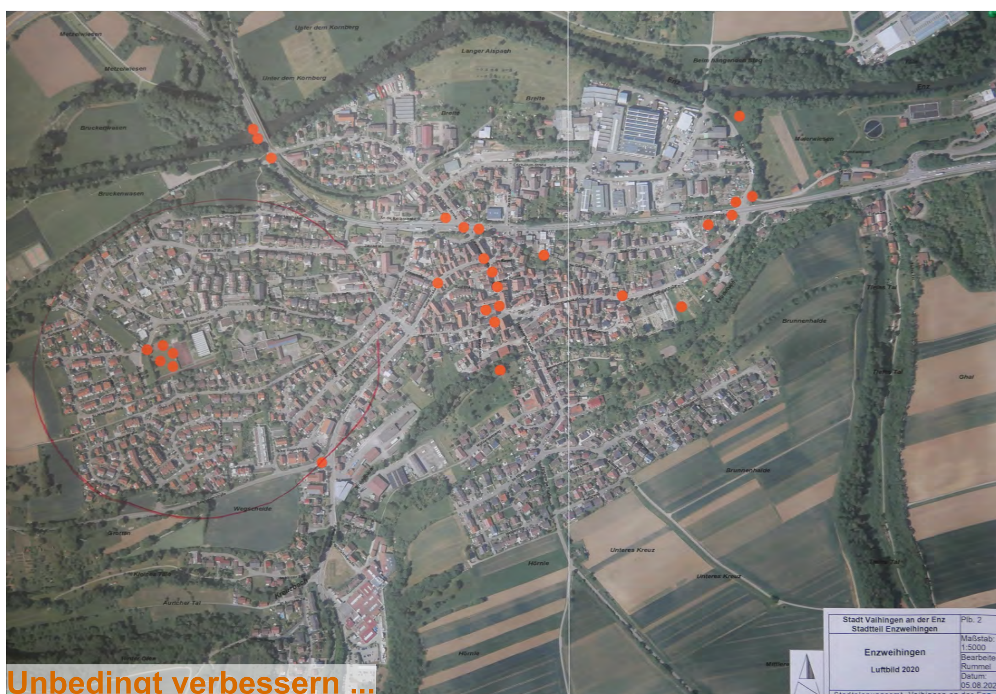
Unbedingt verbessern ...