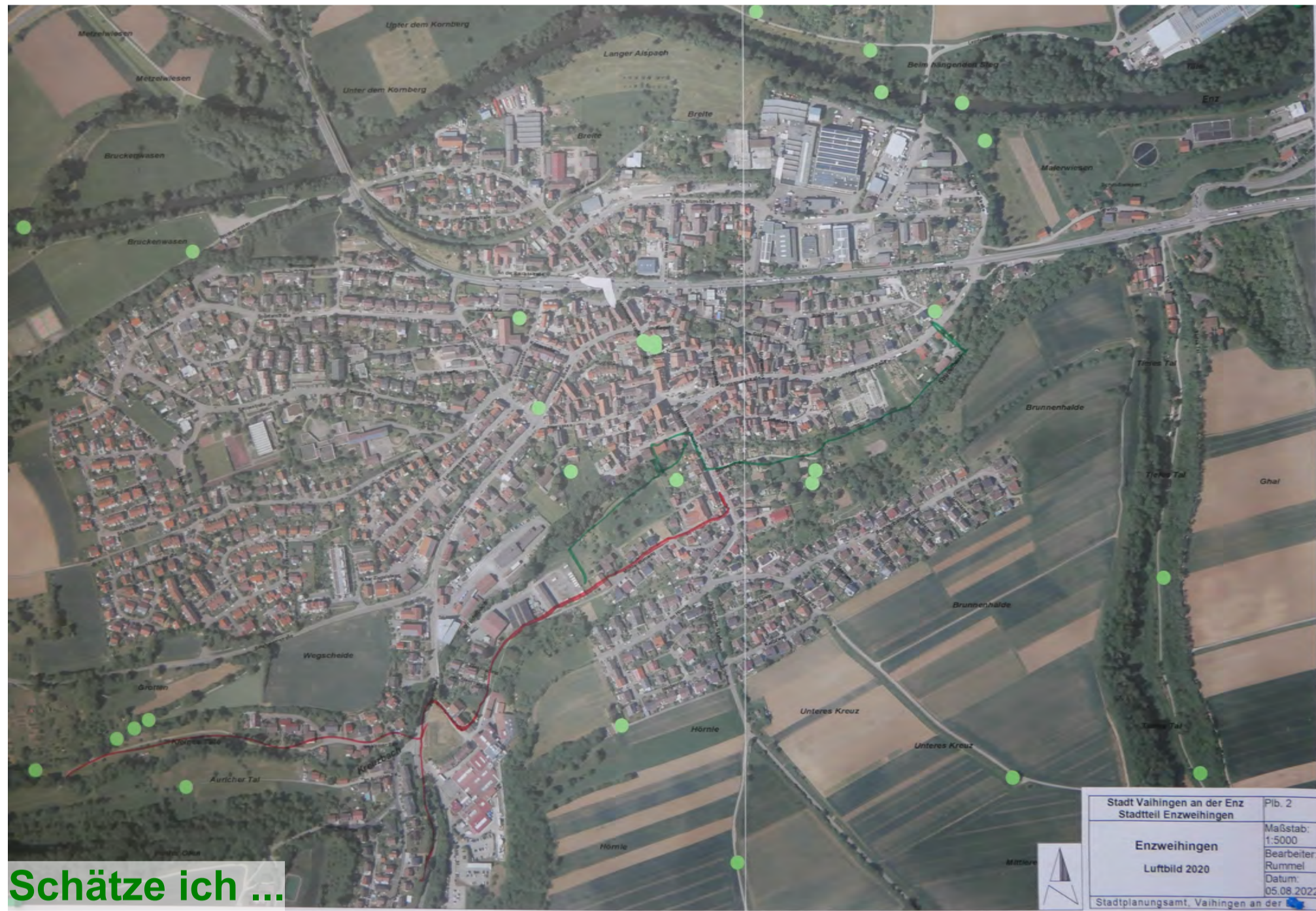
Schätze ich ...