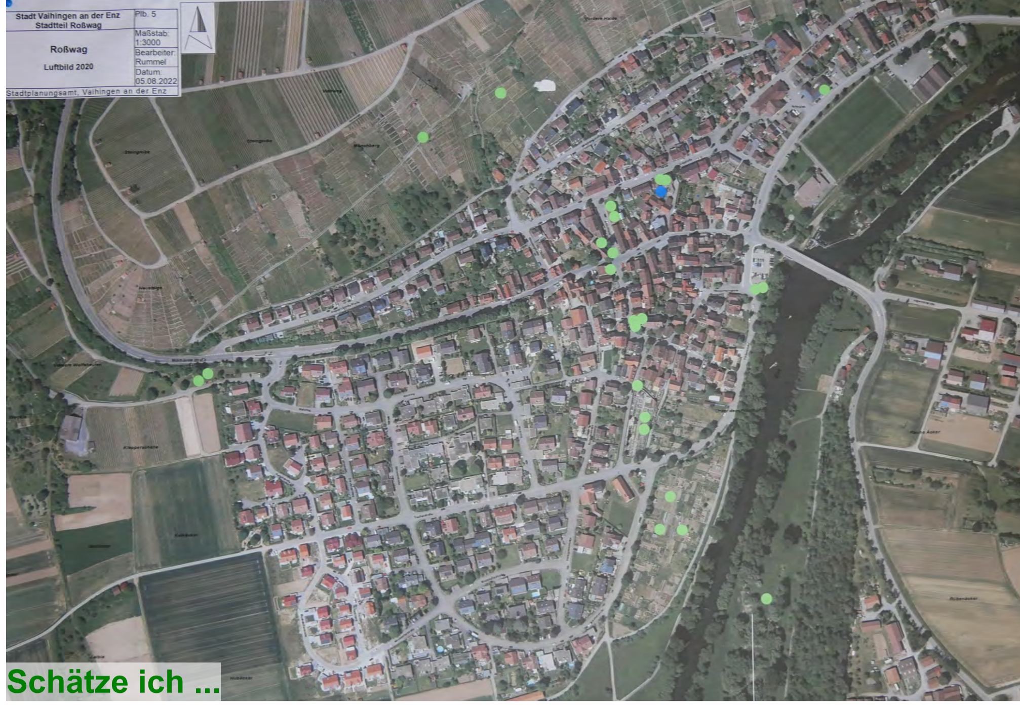
Schätze ich ...