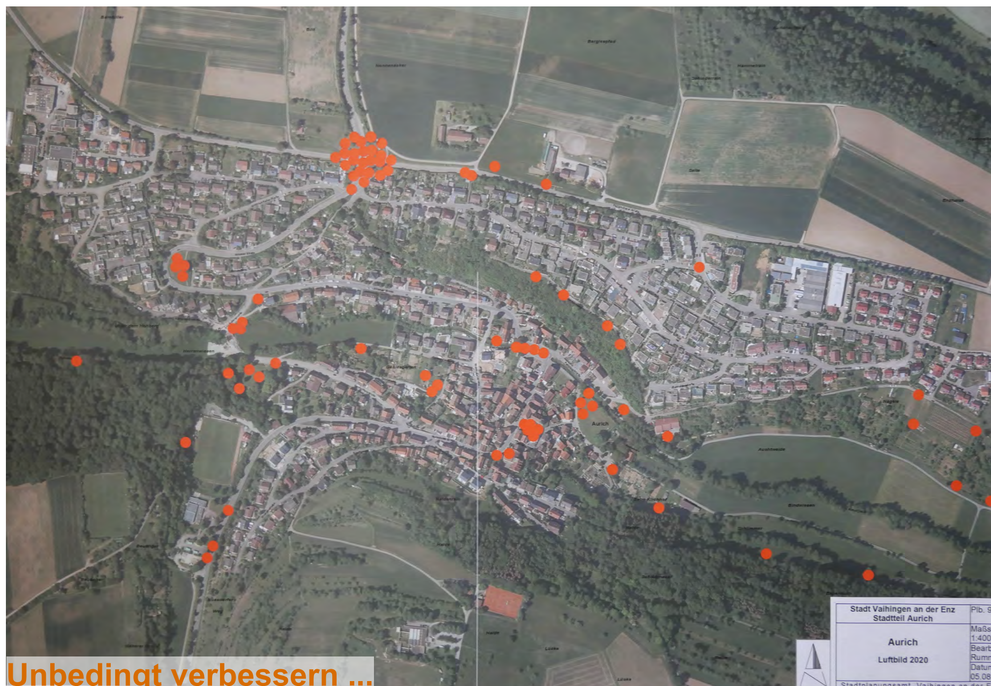
Unbedingt verbessern ...