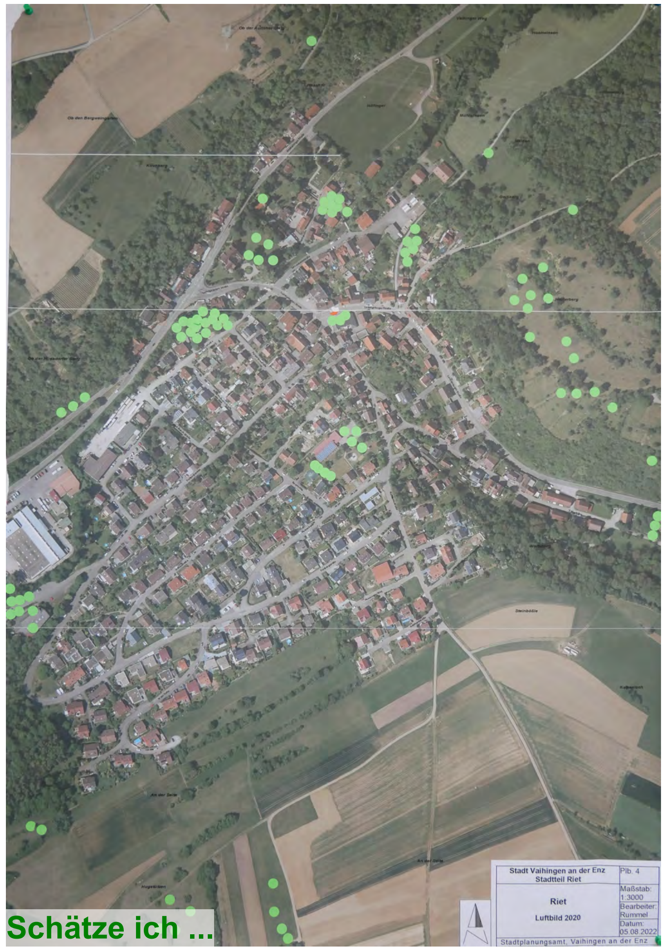
Schätze ich ...