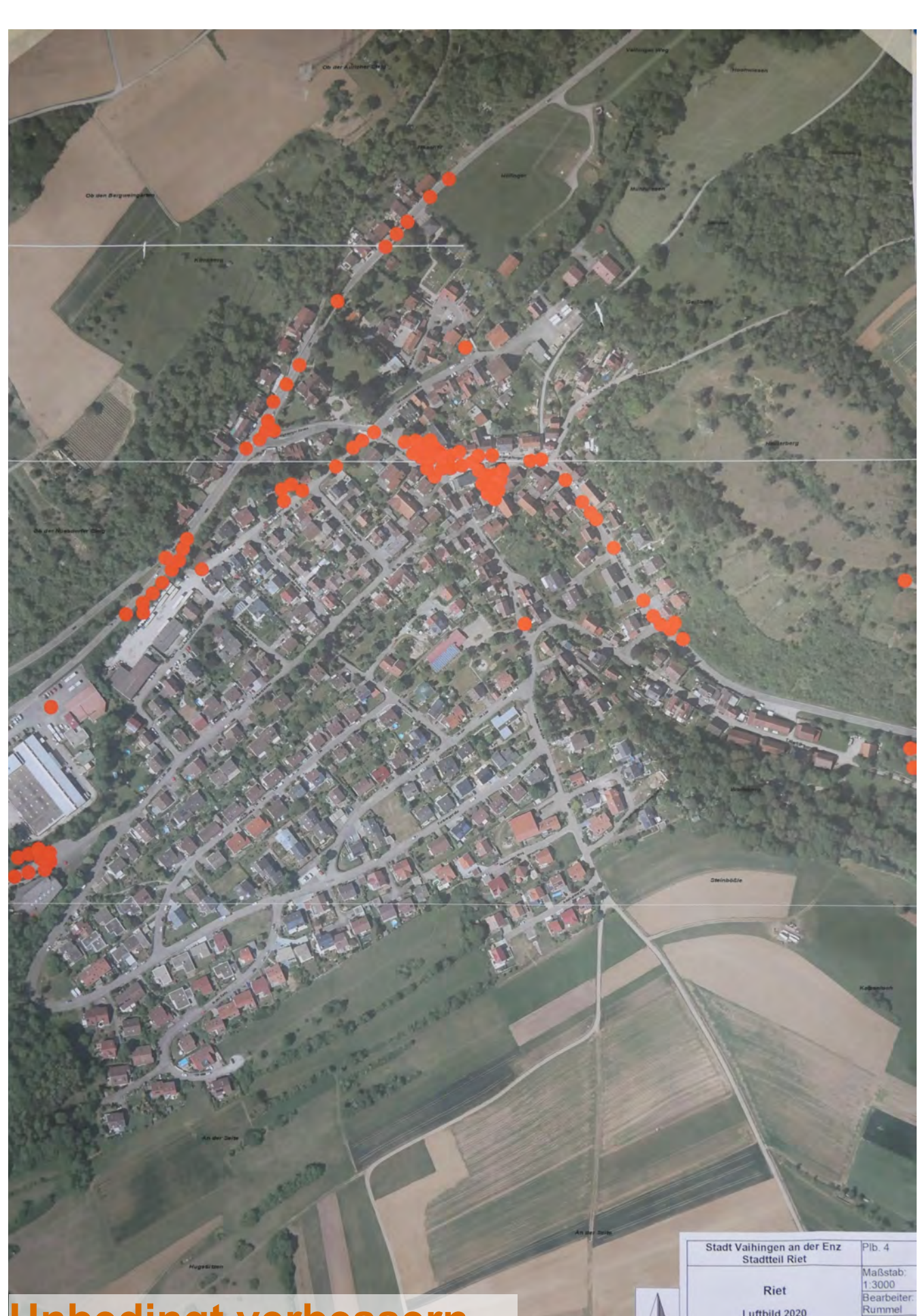
Unbedingt verbessern ...