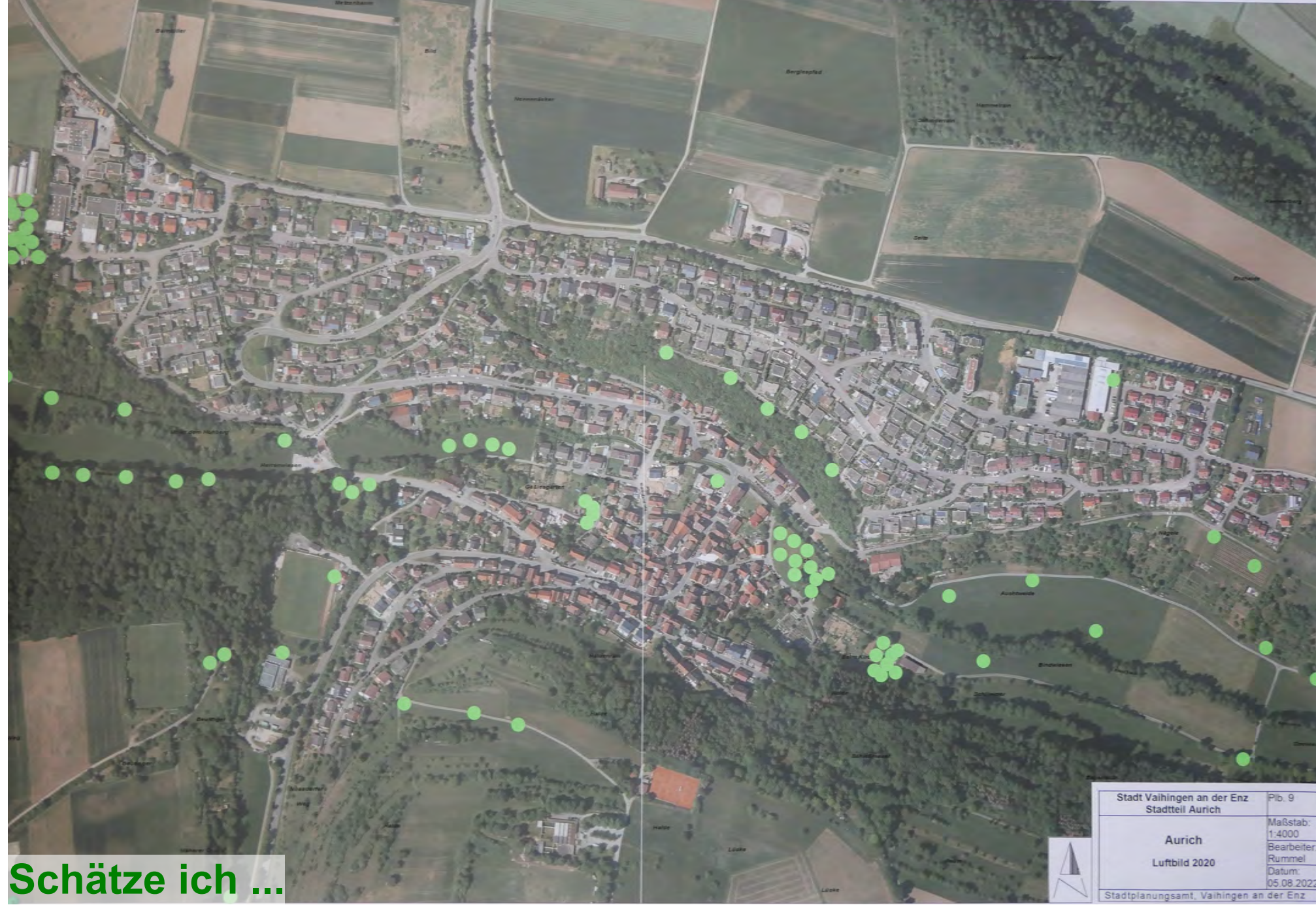
Schätze ich ...